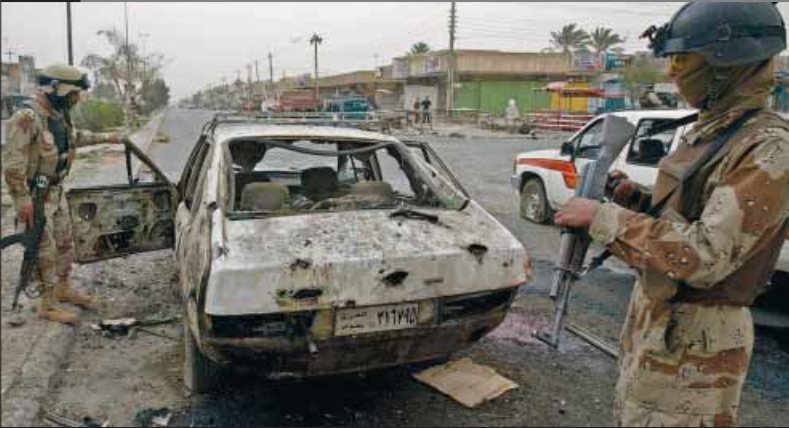
IRAAKSE POLITIEMANNEN in Bagdad inspecteren een auto die verwoest is door een bom. De bom was bedoeld voor de Iraakse politie, maar doodde tien burgers en verwondde er twintig.