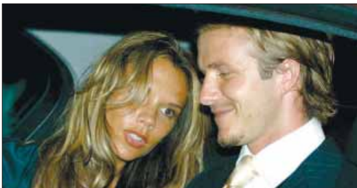
HET GEZIN Beckham heeft het er druk mee om hun liefdesleven te beschermen.

DE BRITSE voetballer David Beckham en zijn echtgenote, ex-Spice-girl Victoria, hebben gisteren een schikking getroffen met de sensatiekrant News of the World . Het beroemde echtpaar had een rechtszaak aangespannen tegen het blad omdat het had geschreven dat hun huwelijks op springen zou staan.