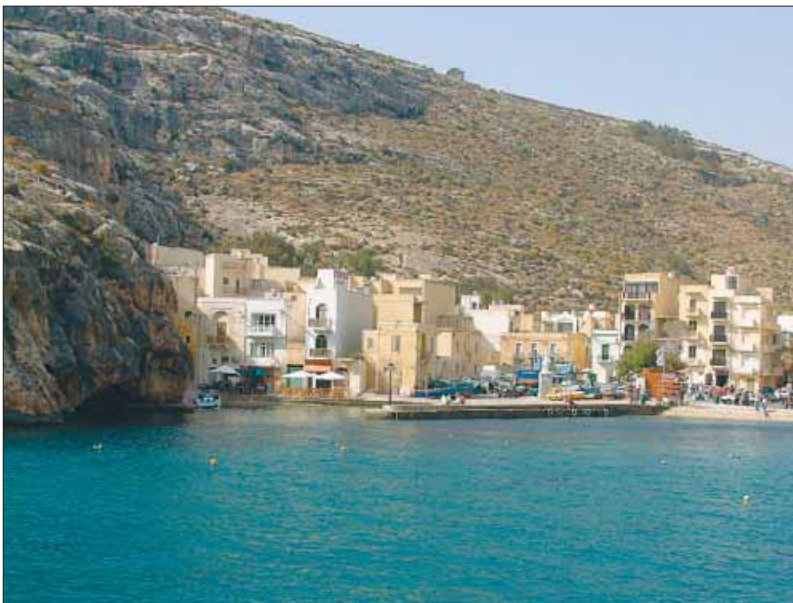
IN EEN van de vakantieverblijven op Gozo waan je je alleen op de wereld.

Nergens een teken van leven, zover als je kunt kijken. Maar met alle nodige luxe plus zelfs een privé-zwembad en grote tuin waar je 's avonds altijd kunt barbecuen, met dank aan het zwoele weer op Gozo.