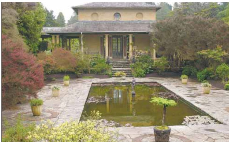
OVERDAG MOET je genieten van de tuinen, want er is te weinig stroom op het eiland om deze 's nachts te verlichten.

Ilnacullin is bij velen bekend onder de naam Garinish Island. Dat bleek soms lastig omdat er ook