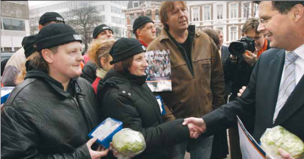
ACTIEVOERDERS VAN FNV Bondgenoten hebben gisteren gedemonstreerd voor de Sociaal Economische Raad. Nederlandse en Poolse werknemers betoogden voor gelijk loon voor gelijk werk.