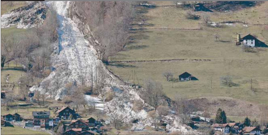
EEN GROTE lawine trof het dorpje Oberried in Bern, Zwitserland. Het is de grootste lawine in 50 jaar in Bern.