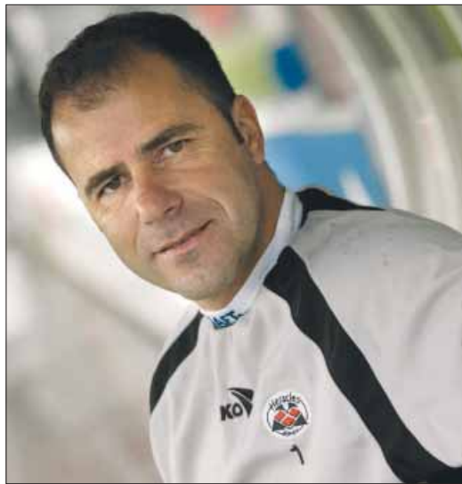
"WE ZULLEN hard moeten werken, maar ik ben optimistisch."

5 Eind vorig seizoen vocht Heracles zich de eredivisie binnen. Nu is er de spanning om in de eredivisie te blijven. Een andere stress? "Raakvlakken zijn er zeker. In beide gevallen moet de spelersgroep immers onder enorme druk presteren. Als trainer is het mijn taak om de druk zoveel mogelijk bij mijn spelers weg te nemen. Ze moeten zich volledig kunnen focussen op het voetbal."