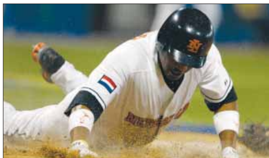
OOK IVANON Coffie kon de nedertaag niet verhinderen.

Op het WK verraste Nederland nog, maar het World Baseball Classic is toch een ander verhaal. Hier doen de beste spelers ter wereld aan mee. Nederland kwam erachter tegen Puerto Rico.