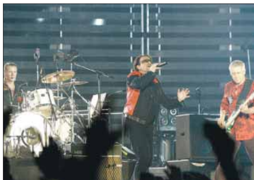
ROCKGROEP U2, doorgaans goed voor spetterende shows.

DE IERSE rockgroep U2 heeft een tournee door Australië, Nieuw-Zeeland, Japan en Hawaï afgezegd, omdat een naast familielid van één van de bandleden ziek is. Dat heeft tourpromotor Arthur Fogel bekendgemaakt. "Elke fan van U2 zal begrijpen dat