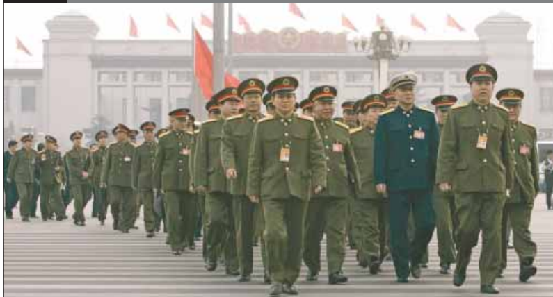
DE REGERING VAN China is woedend op de Japanse minister van Buitenlandse Zaken Taro Aso, omdat hij Taiwan een land noemde. Een Chinese militaire delegatie arriveert voor overleg in het Volkscongres.